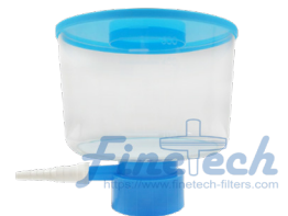
生物濾杯 / 無菌濾杯