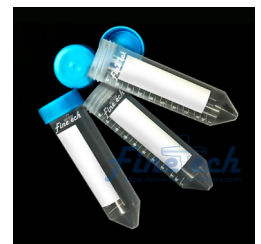
15mL /50mL 離心管