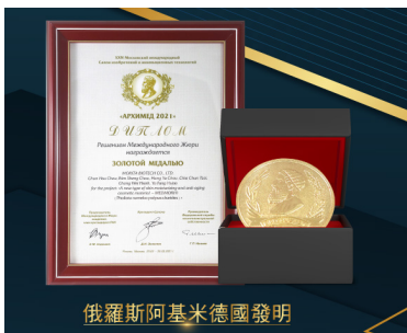
俄羅斯阿基米德國發明