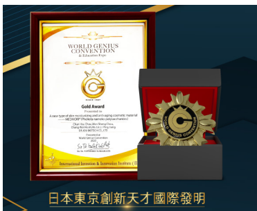
日本東京創新天才國際發明