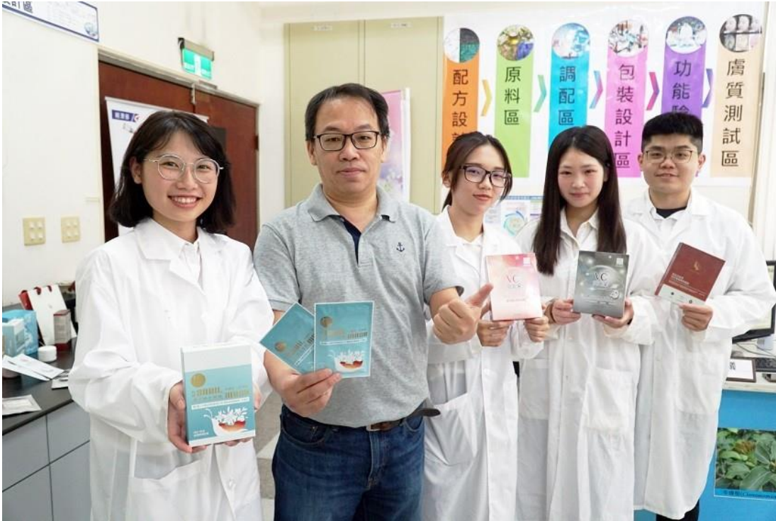
大葉大學美粧品與醫美特色基地幫助學生接軌產業。

大葉大學美粧暨醫美研發基地提供企業原料研發、功能驗證、產品開發一條龍服務，輔導美粧業者引進新技術、開發新產品，同時幫助傳統企業轉型，跨足美粧市場，提升市場競爭力。學生參與產學計畫的表現深獲廠商肯定，不少廠商都承諾優先錄用大葉學子。